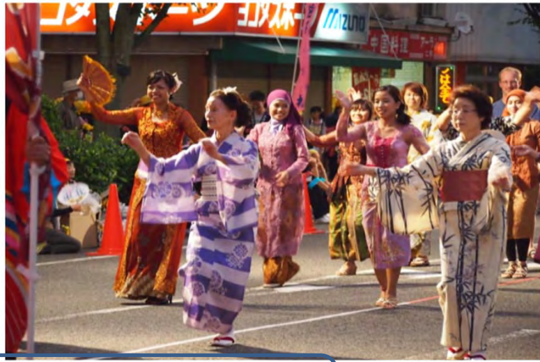
笠岡夏祭り (よっちゃんれ)