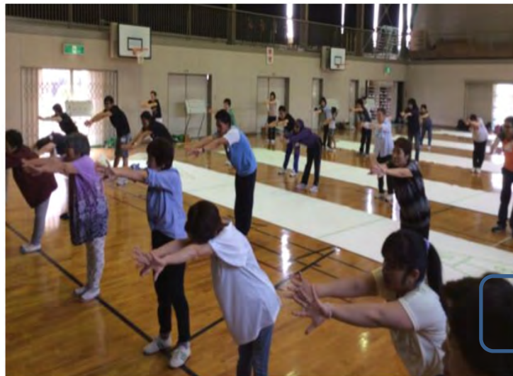
地域の婦人会との交流