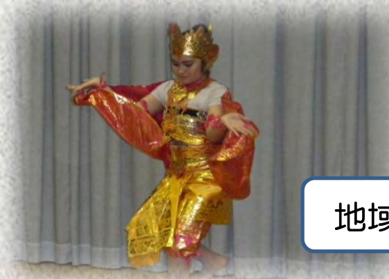
地域の敬老会にて