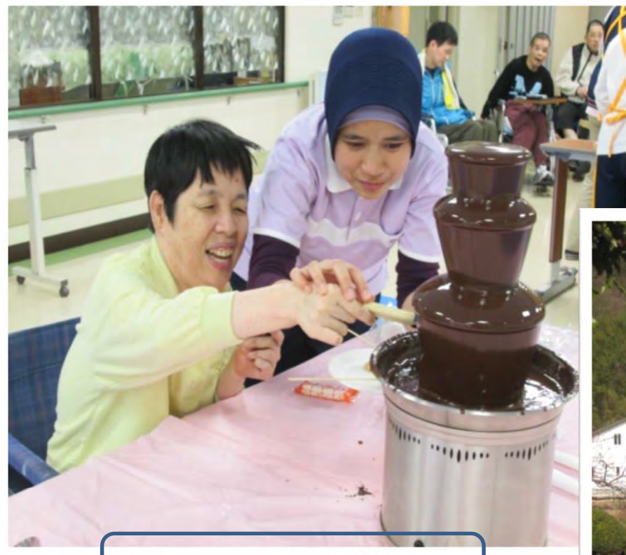
チョコレートタワー