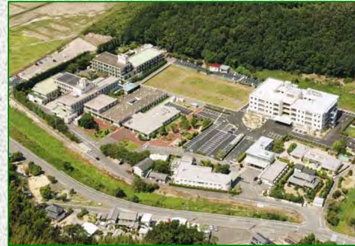
天神荘・こうのしま荘