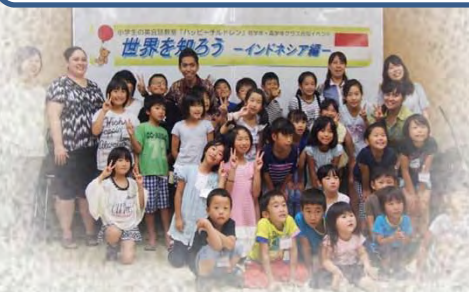
ハッピーチルドレン