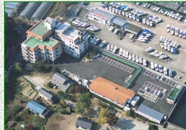
天神介護老人保健施設